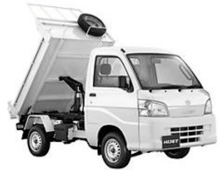
ダイハツハイゼット4WD