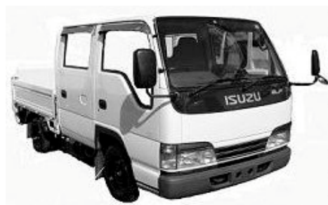
イズメルフWキャブ仕様