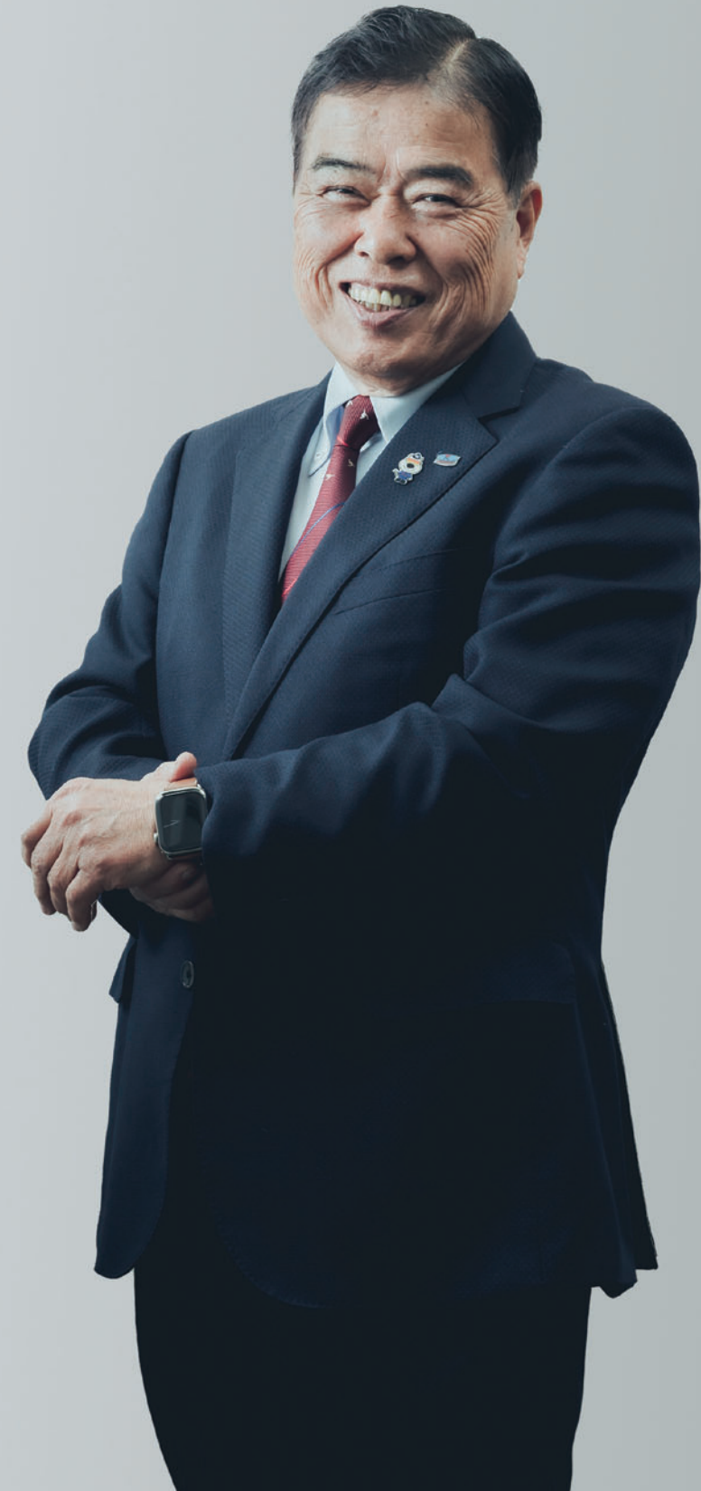
株式会社キナン 代表取締役会長

ときに叱り、ときにやさしく温かく育ててくださったお取引先様。機械と情報をくださるメーカー様、サプライヤー様、金融機関様、その他の方々のお陰によって、今日の私たちがいます。この場を借りて皆様への深い感謝をお伝えするとともに、これからもスピードを緩めることなく、「現場主義」かつ5年先、10年先を見て思い立ったらすぐ行動する。その歩みを続けていこうと決意を新たにしております。