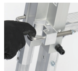
手すりロックは指1本で 操作可能