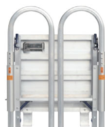
手すりをたたんで収納可能